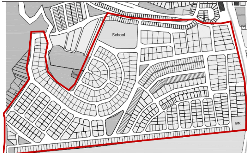
نقشه شماره ۲: محدوده مورد مطالعه

و این تعداد حاکی از آن است که نرخ پاسخ‌دهی در این تحقیق ۶۲ درصد می‌باشد. از پاسخ‌دهندگان، ۸۱ نفر مرد (۵۰/۶ درصد) و ۷۹ نفر زن (۴۹/۴ درصد) بودند. ارقام یاد شده نسبت جنسیت شرکت کنندگان در این تحقیق را نشان می‌دهند که نسبت متناسبی به نظر می‌آید. متوسط سن بین ۴۵ تا ۵۴ سال ( SD = 1/18 ) و متوسط طول مدت اقامت در خانه و محله مورد نظر بالاتر از ۱۰ سال می‌باشد.