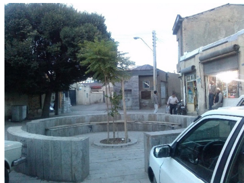
تصویر ۵: دسترسی‌های نامناسب منتهی به مرکز محله و تبدیل آن به پارکینگ