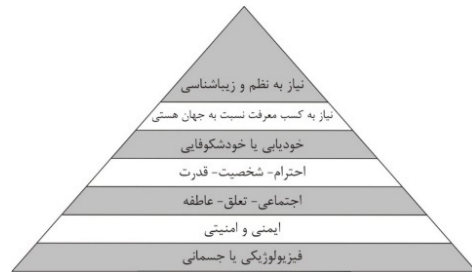
تصویر ۱: هرم مازلو

وجود دارد. این رویکرد در واقع، زمینه‌های اجتماعی، فیزیکی و روان‌شناختی ارتکاب جرم را شناسایی کرده و چهار نوع راهبردی برای کاهش فرصت ارتکاب جرم ارائه می‌دهد: ۱- افزایش امکان مشاهده جرم و جنایت، ۲- افزایش خطر ارتکاب جرم، ۳- کاهش منفعت‌های ارتکاب جرم و ۴- از بین بردن بهانه‌های ارتکاب جرم (Souri, 2010: 33).