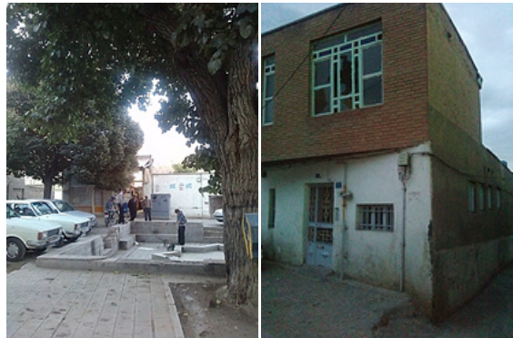
تصویر ۴: پنجره‌های شکسته و فضاهایی با اختلاف سطح در مرکز محله

پس از مشاهدات میدانی که در مرکز محله آخوند انجام شد، نکاتی در مورد راهبردهای رویکرد CPTED مورد مذاقه قرار گرفت. با توجه به راهبردهای نظارت طبیعی رویکرد CPTED، موارد زیر مشاهده گردید (تصویر شماره ۴).