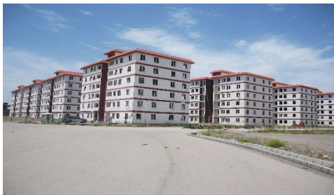
تصویر شماره ۶: بلوک‌های هم‌شکل و فضاهای یکنواخت و راکد میان آنها در مجتمع وحدت