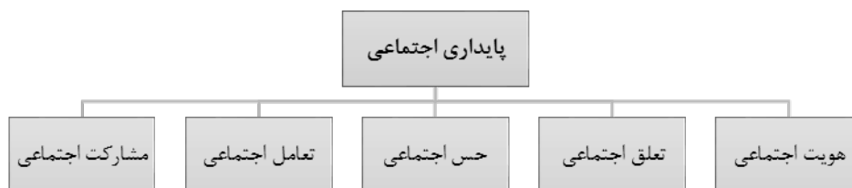
دیاگرام شماره ۲: متغیرها و مفاهیم اجتماعی پایداری اجتماعی

روش تحقیق حاضر ترکیبی از روش‌های کمی و کیفی است، بعد کمی راهبرد پژوهش به منظور آزمون فرضیه تحقیق، راهبرد همبستگی است. در این راهبرد ثبت ارتباط طبیعی میان متغیرها مورد نظر است و یکی از امتیازهای مهم آن، قابلیت مطالعه گسترده وسیعی از متغیرهاست (Grote & Wang, 2009). ضمن بررسی تحقیقات پیشین و انجام مطالعات اسنادی، اصول و مؤلفه‌های شکل دهنده مفاهیم اجتماع‌پذیری فضا و پایداری اجتماعی به صورت مدل‌های مفهومی مطابق دیاگرام‌های شماره ۱ و ۲، به دست آمده است. به منظور سنجش اجتماع‌پذیری فضا، مؤلفه‌های بعد کالبدی این مفهوم و برای ارزیابی پایداری اجتماعی به ابعاد انسانی و اجتماعی آن پرداخته شده است. در واقع به طور کلی تأثیر ابعاد کالبدی فضا بر ابعاد انسانی و اجتماعی استفاده‌کنندگان از فضا مورد سنجش واقع شده است. گفتنی است عدم پرداختن به ابعاد دیگر مفاهیم جزو موانع و محدودیت‌های پژوهش محسوب می‌گردد. برای سنجش و ارزیابی مؤلفه‌های یادشده در نمونه‌های موردی (مجتمع‌های