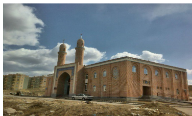
تصویر شماره ۹: مسجد در مجتمع اندیشه