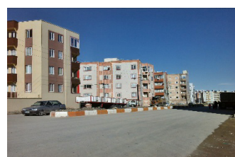
تصویر شماره ۲: از راست، مجتمع اندیشه، مجتمع نیایش و مجتمع وحدت

نسبتاً مطلوبی قرار دارد. با این حال پاسخگویان نتوانسته اند حس قرابت، دل بستگی و احساس هویت مطلوبی در رابطه با فضاهای عمومی مجتمع داشته باشند؛ که با توجه به سابقه کم سکونت در این مجتمع قابل توجیه است. نبود فضاهای بازی کودکان و عدم بازی پذیری فضاهای عمومی موجب کم بودن میزان این مؤلفه شده است (تصویر شماره ۳). گفتنی است که تنها فضای سرپوشیده عمومی برای جمع شدن اهالی، مسجد مجتمع است (تصویر شماره ۴).