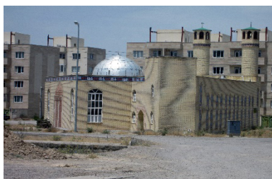
تصویر شماره ۴: مسجد، تنها مکان عمومی در مجتمع نیایش