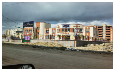
تصویر شماره ۸: مدرسه ابتدایی در مجتمع اندیشه