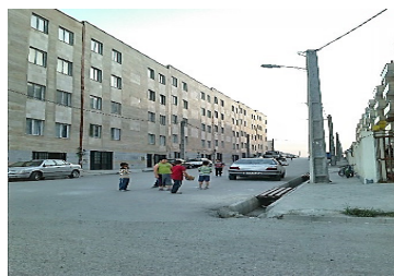
تصویر شماره ۳: نبود فضای بازی کودکان در مجتمع نیایش