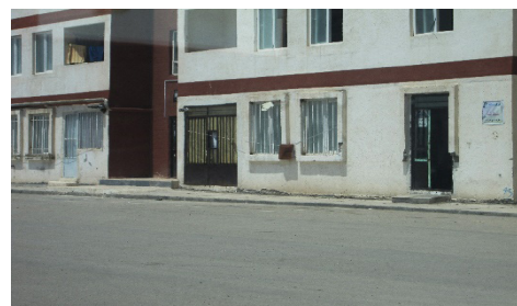
تصویر شماره ۵: ضعف در ساخت و اجرای ساختمان‌ها در مجتمع وحدت