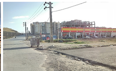
تصویر شماره ۷: مرکز تجاری در مجتمع اندیشه