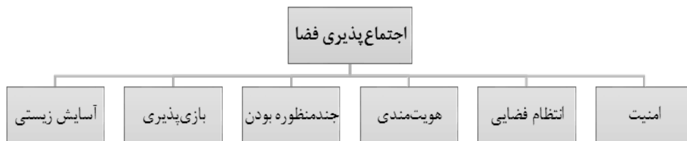
دیاگرام شماره ۱: مؤلفه‌های کالبدی اجتماع‌پذیری فضا

وودکرفت عوامل پایداری اجتماعی شهر را عدالت اجتماعی درون نسلی و برون نسلی، مشارکت و دموکراسی محلی، بهداشت، کیفیت زندگی و رفاه، ریشه‌کن کردن محرومیت اجتماعی، سرمایه اجتماعی، تعامل اجتماعی، ایمنی، توزیع عادلانه درآمد، نظم اجتماعی، حس اجتماعی و تعلق، سنت‌های فرهنگی و سازمان‌های اجتماعی فعال می‌داند (Woodcraft, 2012). تین و همکارانش توسعه پایدار اجتماعی را شامل چهار معیار اصلی عدالت اجتماعی، همبستگی اجتماعی، مشارکت و امنیت معرفی