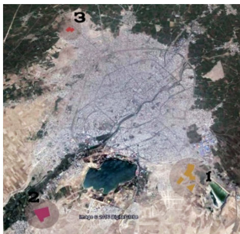
تصویر شماره ۱: موقعیت مجتمع های مسکن مهر در شهر اردبیل: ۱. مجتمع اندیشه، ۲- مجتمع نیایش و ۳. مجتمع وحدت