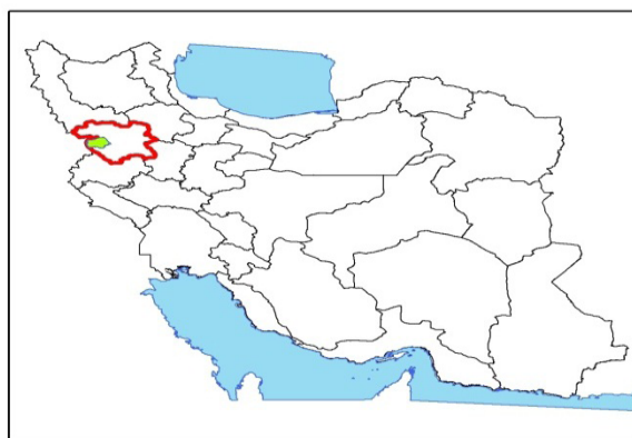
تصویر شماره ۲: نقشه محدوده مورد مطالعه