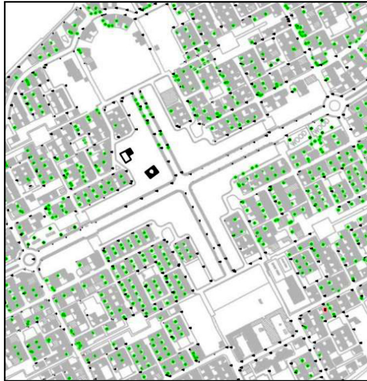
تصویر شماره ۳: بافت توده و فضا در مرکز محله پشت سیلو