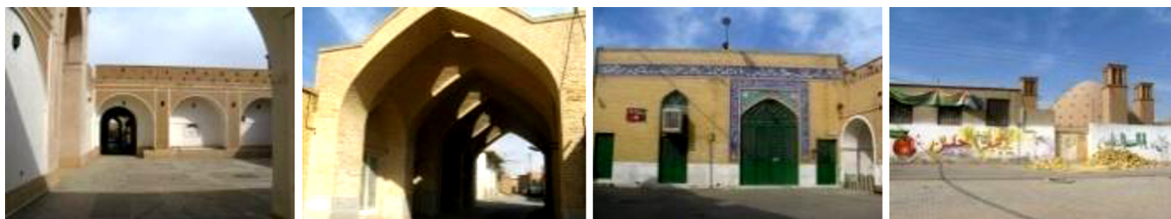
تصویر شماره ۲: مرکز محله یعقوبی

۳٫۴٫۲. مرکز محله پشت سیلو: مرکز محله پشت سیلو واقع در ناحیه دو از منطقه سه شهر یزد و به عنوان چهارمین محله در این ناحیه مطرح می‌باشد که در بافت جدید و نوساز جنوب غربی این شهر قرار گرفته است. محله پشت سیلو که به کوی دانشگاه شناخته می‌شود، از شمال به بلوار فردوسی و از جنوب به بلوار پروفیسور حسابی، از شرق به خیابان امیرکبیر و از غرب به خیابان فلسطین محدود می‌شود. مرکز محله پشت سیلو در همجواری