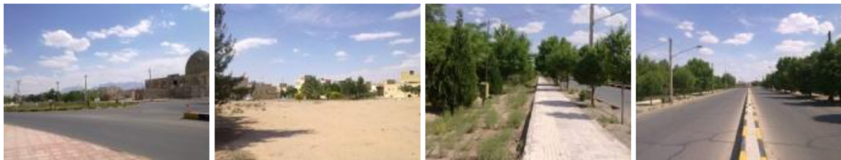
تصویر شماره ۴: مرکز محله پشت سیلو