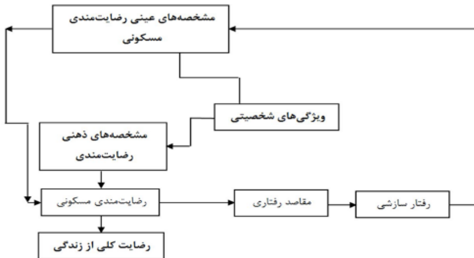
تصویر شماره ۱: مدل رضایت مندی محیط مسکونی (Amerigo & Aragones, 1997).

رضایت مندی واحد همسایگی و رضایت مندی محله، مورد مطالعه قرار گرفتند. با توجه به اهمیت عامل اقتصادی برای متقاضیان مسکن مهر، مؤلفه اقتصادی نیز به آن اضافه شد. سپس با استفاده از منابعی که در جدول زیر به آنها اشاره شده است، مؤلفه‌ها و شاخص‌ها استخراج شدند و پس از بومی‌سازی آنها با توجه به ویژگی‌های منطقه، مدل مفهومی استخراج شد (جدول شماره ۱).