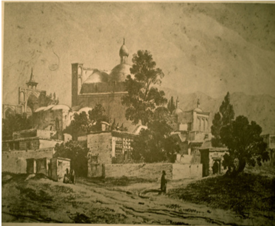
تصویر شماره ۱: نمای بافت قدیم شهر بروجرد