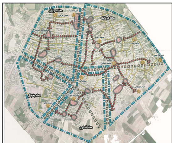
تصویر شماره ۲: هسته اولیه شهر بروجرد

می‌توان به شهر زیست‌پذیر رسید. بخش مرکزی شهر بروجرد به دلیل وجود عناصر قدیمی و با ارزش چون آثار تاریخی مانند مسجد امام، بازار، میدان، مراکز متعدد مذهبی و قرارگیری در هسته اولیه شهر و بافت فرسوده، گذرهای قدیمی متعدد با کوچه‌های تنگ و باریک که از مشخصه‌های بافت قدیم شهرهاست، دارای بیشترین فضای هویتی این محدوده است؛ با توجه به رشد شهر بروجرد بعضی محله‌های شکوفا و پررونق و برخی محله‌های دیگر از این رونق برخوردار نیستند. در نتیجه زیست‌پذیری و کیفیت زندگی، از یک محله به محله دیگر متفاوت است. با توجه به شرایط خاص بخش مرکزی شهر، به نظر می‌رسد نظریه زیست‌پذیری شهری ضمن توجه به کاربری ترکیبی به‌عنوان یک اصل اساسی و تأکید بر مفاهیمی چون سرزندگی، حس تعلق به مکان، کیفیت زندگی و به طور کلی تأکید بر بعد انسانی، به طور ذاتی با افزایش شور و هیجان و بهبود کیفیت زندگی عجین شده است. بنابراین مناسب‌ترین گزینه برای ارتقا و بهبود شرایط زیست در این بخش است. با توجه به ماهیت و ابعاد مسئله، این پژوهش تلاش دارد به سئوالات زیر پاسخ دهد: ۱- سطح زیست‌پذیری در بخش مرکزی شهر بروجرد در چه وضعیتی است؟ ۲- عوامل مؤثر در زیست‌پذیری محله‌های بخش مرکزی شهر بروجرد کدامند؟ ۳- وضعیت کدام محله بخش مرکزی بروجرد از منظر زیست‌پذیری مناسب است؟