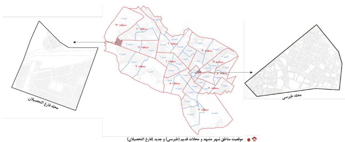
تصویر شماره ۲: معرفی نمونه‌های مطالعاتی