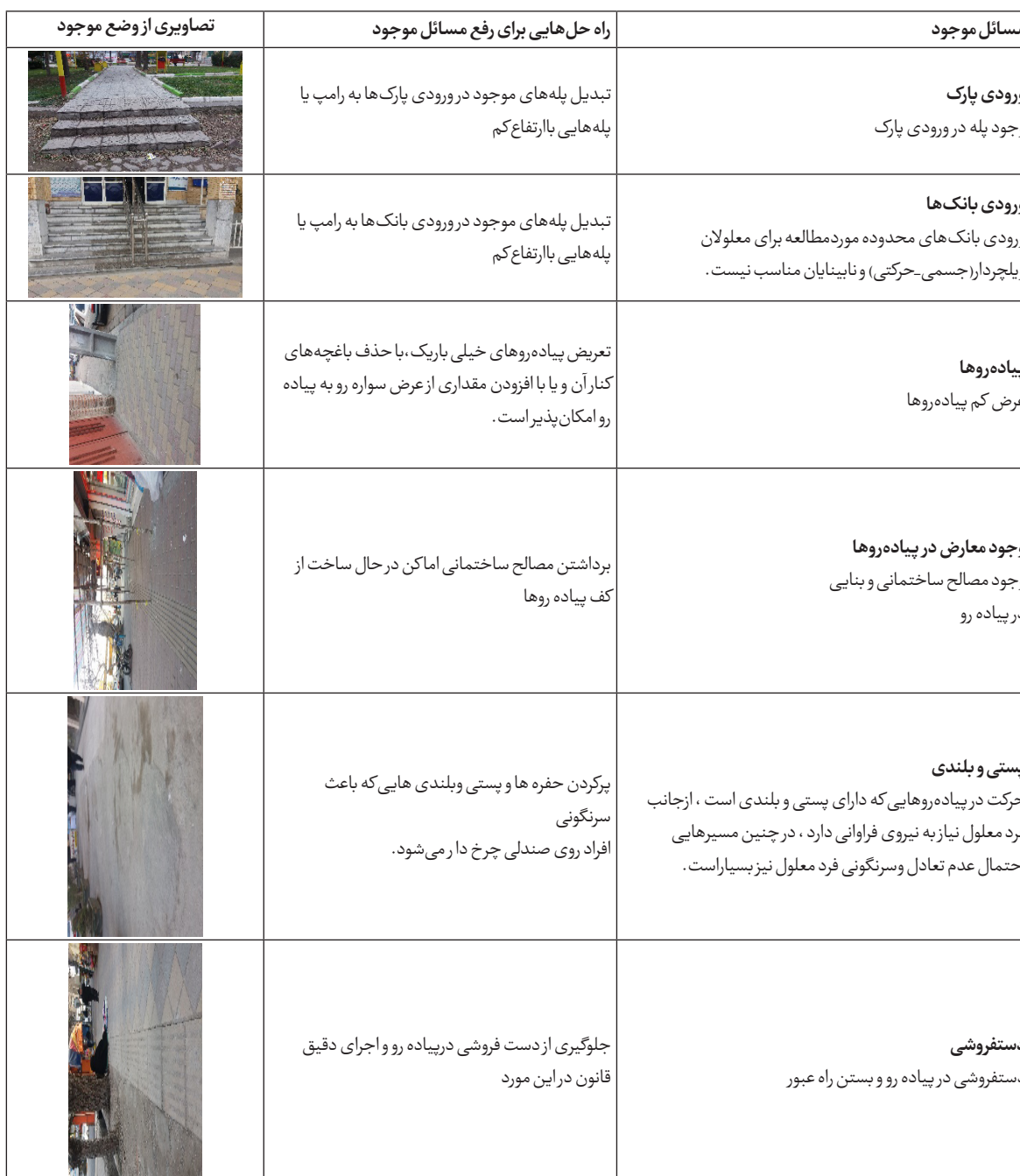
جدول شماره ۱۲: مسائل وضع موجود و ارائه راه حل‌هایی برای مناسب‌سازی بخش مرکزی شهرداری