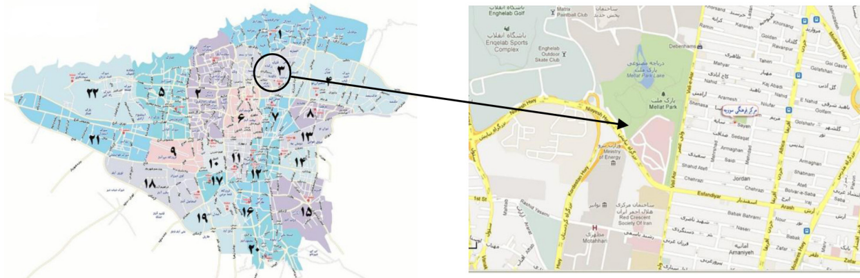
تصویر شماره ۱: نقشه پارک ملت و موقعیت آن در شهر تهران

بوستان ملت در منطقه سه شهرداری تهران قرار دارد و براساس موقعیت خاص خود در دو بخش متفاوت احداث گردیده است (تصویر شماره ۱). قسمتی از بوستان که به بلوار کنار جاده موسوم است، به موازات خیابان ولیعصر (عج) در قطعه‌ای از پیاده‌رو گسترده شده و در سال ۱۳۴۷ تأسیس گردید. بخش دیگر بوستان بر روی تپه‌ها بنا شده و در سال ۱۳۵۳ احداث گردیده است. طراحی این قسمت به سبک بوستان‌های