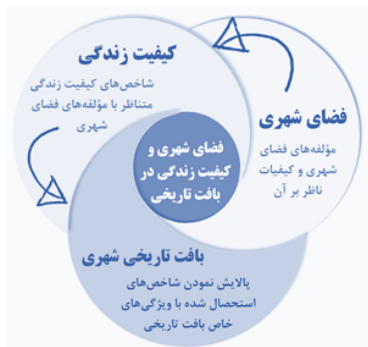
نمودار شماره ۲: سه بخش اصلی پژوهش و ارتباط آنها

مدل مفهومی تأثیر فضاهای شهری در این مهم تبیین گردد. بر مبنای پیشینه تحقیق و دیدگاه‌های نظری، مؤلفه‌ها معیارها و شاخص‌های مربوطه در سه بخش تنظیم شده است (نمودار شماره ۲).