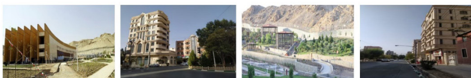
تصویر شماره ۱: تصاویر فضاها، عمومی شهرک قدس

و تحلیل عاملی مرتبه دوم و آزمون همبستگی پیرسون در نرم‌افزار SPSS 23 و Amos Graphic 26 انجام گرفته است. به طور کلی می‌توان مؤلفه‌ها و شاخص‌های شکل‌گیری و تقویت حس مکان را منطبق بر ادبیات موضوع تحقیق و نظریه اکثر صاحب‌نظران، سه مؤلفه اصلی در نظر گرفت که ساختار تحلیلی این مقاله نیز بر سه مؤلفه (ادراک، فعالیت و کالبد) ۱۲ شاخص و ۴۵ زیرشاخص تنظیم گردیده است. مدل مفهومی تحقیق متشکل از مؤلفه ادراکی-معنایی با شاخص‌های هویت و اصالت، نقش‌انگیزی و تصویر ذهنی، مؤلفه کارکردی-فعالیتی با شاخص‌های کاربری و فعالیت، قابلیت دسترسی، مبلمان شهری، دعوت‌کنندگی، مشارکت اجتماعی و ایمنی-امنیت و مؤلفه کالبدی-بصری با شاخص‌های انسجام بصری، شکل ساخت و غنای بصری است (جدول شماره ۴).