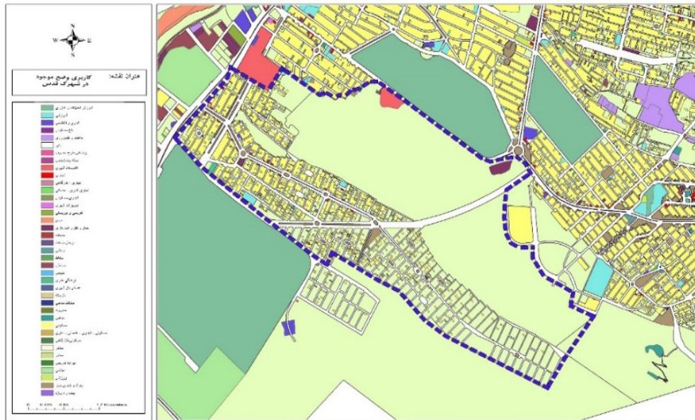
تصویر شماره ۲: نقشه محدوده مورد بررسی