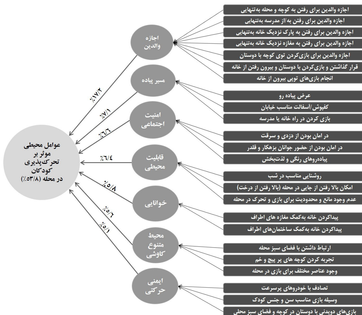
تصویر شماره ۲: مدل اکتشافی تحقیق؛ عوامل ویژگی های محیطی مؤثر بر تحرک و فعالیت فیزیکی کودکان در محله شهری از نظر آنان

عامل هفتم، ایمنی حرکتی: این عامل ۵/۱ درصد از تغییرات واریانس کل متغیرهای پژوهش را تبیین می کند. عامل آخر با سنجه هایی در