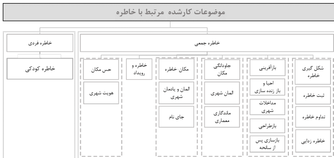
نمودار شماره ۳: موضوعات و اهداف کارشده مرتبط با موضوع خاطره

شده است. در سایر مطالعات، تعدادی مؤلفه انتخاب و در بستر مورد نظر بر مبنای سایر متغیرها، بررسی شده است.