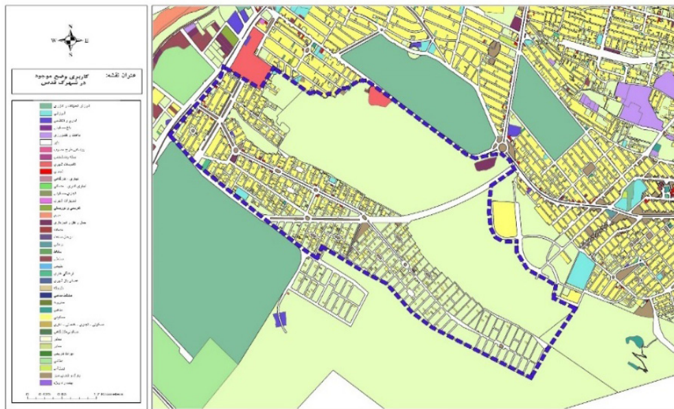
تصویر شماره ۲: نقشه محدوده مورد بررسی