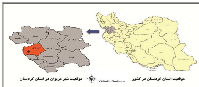
نقشه ۱: موقعیت شهر مریوان و استان کردستان در کشور