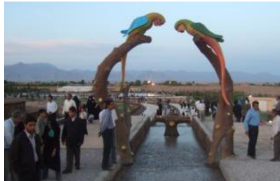
تصویر شماره ۲: پارک بزرگ شهر یزد (تصویر بالا) و پارک کوهستانی شهر یزد (تصویر پایین)