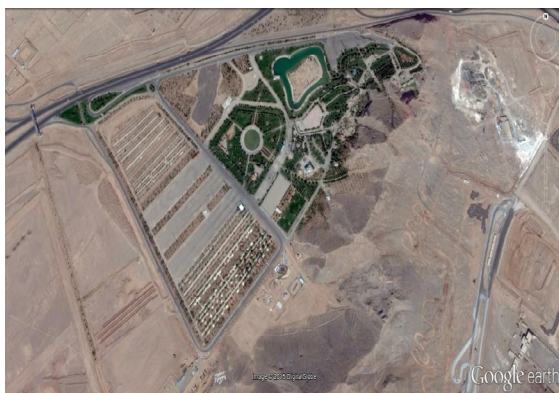
تصویر شماره ۱: پارک بزرگ شهر (بالا) و پارک کوهستانی یزد (پایین)

محدوده پارک کوهستانی یزد به وسعت تقریبی ۱۵ هکتار در اراضی جنوبی شهر یزد و در شرق جاده یزد-تفت و جنوب جاده کمربندی اردکان-مهریز واقع شده است. وجود ارتفاعات با چشم‌اندازها و مناظر طبیعی و همچنین اراضی پست حاشیه این ناهمواری‌ها